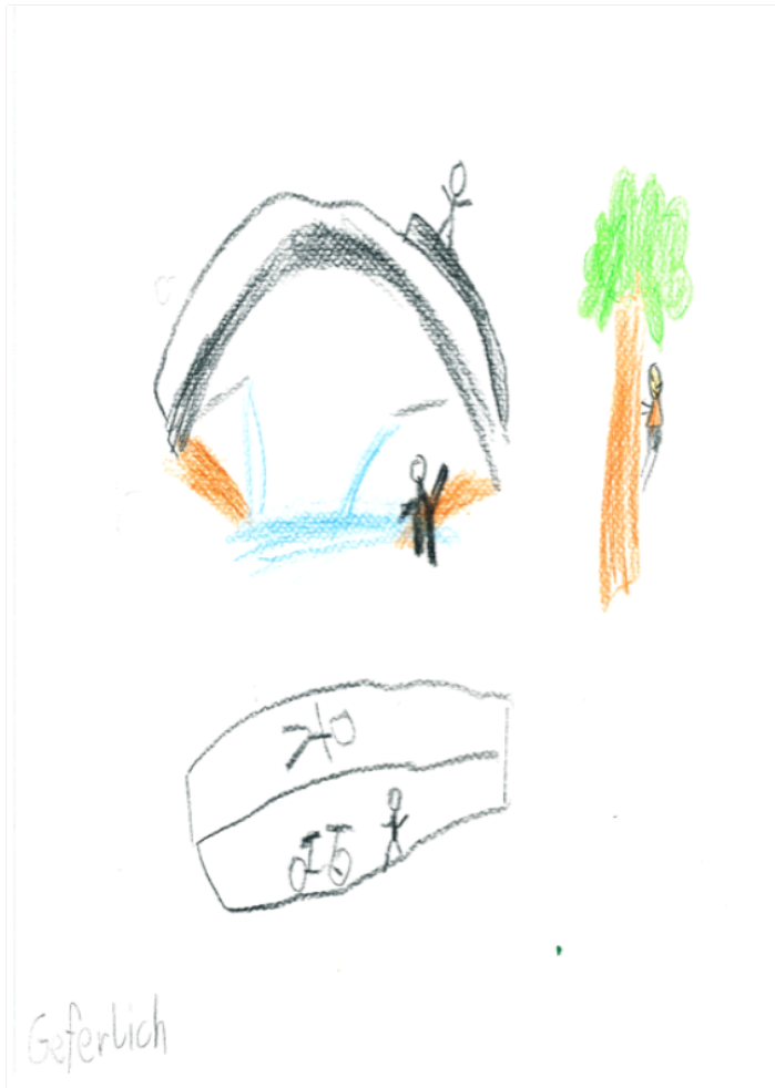
Abb. 3: Zeichnung „Schwierigkeiten beim Überqueren des Radweges“

Partizipation bedeutet in dieser Erweiterung also, den unterschiedlichen Projektpartnern Möglichkeiten zu bieten, ihre Sichtweisen einzubringen und diese für andere nachvollziehbar zu machen oder annehmbar darzustellen. Im Gegenzug dazu müssen partizipative Projekte verantwortungsvoll darstellen, warum jemand oder eine Gruppe nicht eingebunden werden konnte.