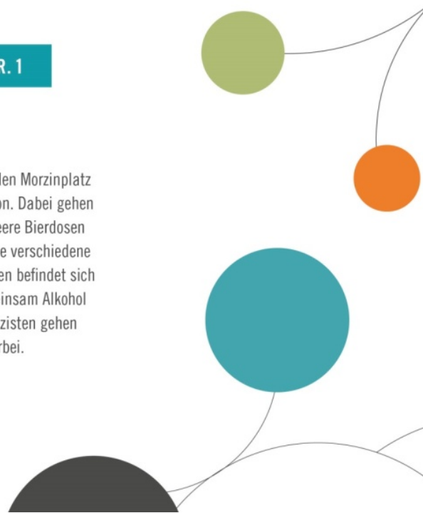
Abb. 2: Vignettenbeispiel „Schwedenplatz“ 4

Es ist Freitag Abend und Sie gehen über den Morzinplatz Richtung Schwedenplatz zur U-Bahnstation. Dabei gehen Sie an einer großen Grünfläche vorbei. Leere Bierdosen liegen auf dem Weg. Auf Bänken sehen Sie verschiedene Menschen, die sich unterhalten. Unter ihnen befindet sich auch eine Gruppe Jugendlicher, die gemeinsam Alkohol trinkt und sich laut unterhält. Zwei Polizisten gehen an der Gruppe Jugendlicher vorbei.